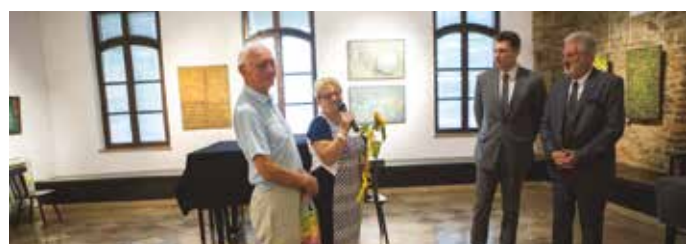
fot. Natalia Pacana - Roman