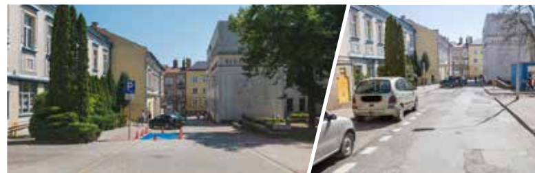
Po i przed rewitalizacją

Wykonawcą zadania był Zakład Usługowo Produkcyjno Handlowy Hażbud sp. z o.o.