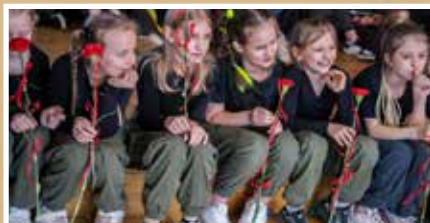
Świętowali Dzień Kobiet - s.8-9