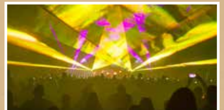
Zbliżają się Dni Gorlic i Festiwal Światła - s.14-15