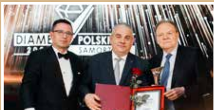
Diament Samorządu dla Gorlic - s.4